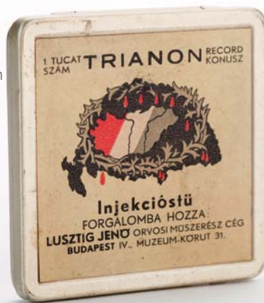
„Trianon” injekciós tű (1930-as évek)