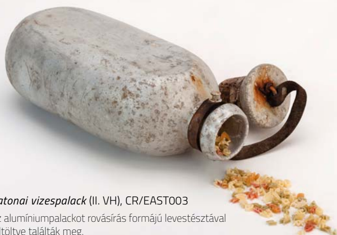
Katonai vizespalack (II. VH), CR/EAST003