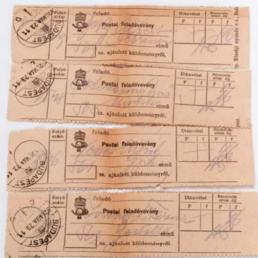
Postai feladóvények (1928) CR/WEST111

Ellenpontként egy Blake-idézetet olvashatunk: Great things are done when men and mountain meet / this is not done by jostling in the street. (Nagy dolgok születnek, mikor emberek és hegyek találkoznak / de nem születnek, ha az utcán tülekednek. A második sor nem szerepel, de logikus