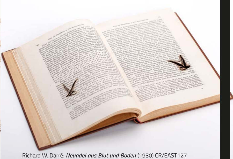
Richard W. Darré: Neuadel aus Blut und Boden (1930) CR/EAST127

A szerző a náci „Blut und Boden” (Vér és Föld) ideológiájának megteremtője, egy magas rangú SS-tisztségviselő, aki a Harmadik Birodalom Mezőgazdasági és Élelmezési miniszteri posztját és egyéb magas pozíciókat töltött be a náci kormányban. Vallási nézeteit illetően a náci mozgalom pogány frakciójához tartozott. Új nemesség a vérből és földből című könyve azt a központi rasszista tant fejt ki, mely szerint az örök idők óta az északi földben gyökerező északi faj tagjai az igazi megalkotói az európai kultúrának. A zsidókat nomádoknak tartotta, akiknek vére „nem volt képes összekapcsolódni a német földdel”. Valószínűleg Darré volt az, aki Hitler és Himmlert meggyőzte arról, hogy a „zsidókérdést” úgy kell megoldani, hogy teljesen eltüntetik őket a német földről.